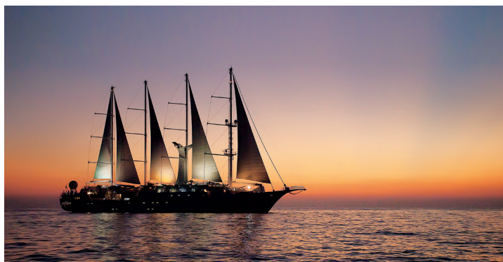
Wind Spirit - 148 passagers

La marina pour sports nautiques, à l'arrière de chacun des navires, permet de s'adonner aux joies de toutes sortes d'activités : kayak de mer, planche à voile, et même du ski nautique !