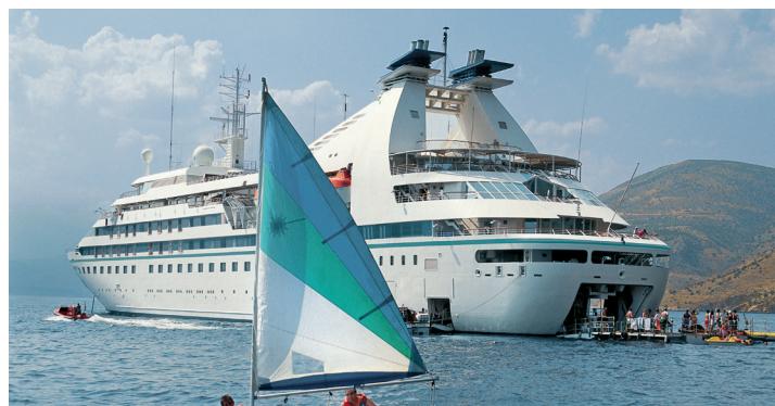
Star Legend - 312 passagers

Retrouvez tous les itinéraires, disponibilités, dates et tarifs en contactant Un Océan de Croisières au 01 45 75 80 80