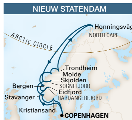
De / A Copenhague 15 jours / 14 nuits