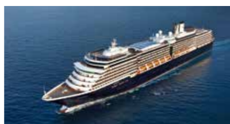
M/s ZUIDERDAM en quelques chiffres

Nbre de passagers : 2 666 Membres d'équipage : 1 036 Mise en service : 2018 Longueur : 297 m