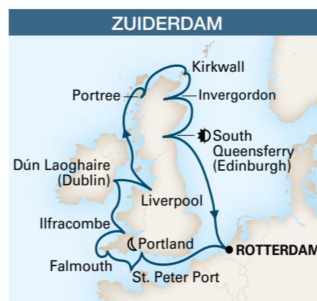
De / A Rotterdam 15 jours / 14 nuits