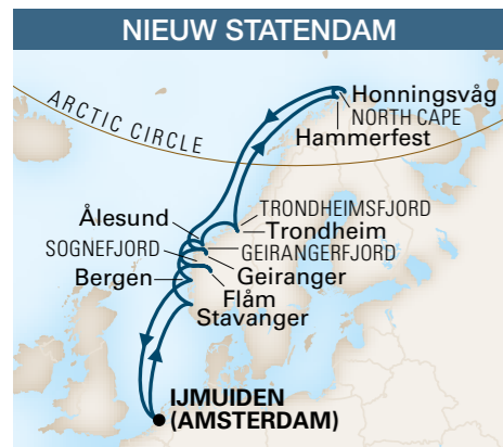
De / A Ijmuiden (Amsterdam) 15 jours / 14 nuits