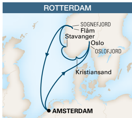
De / A Amsterdam 8 jours / 7 nuits