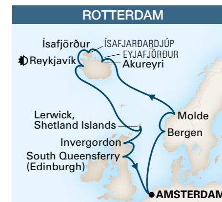
De / A Amsterdam 15 jours / 14 nuits