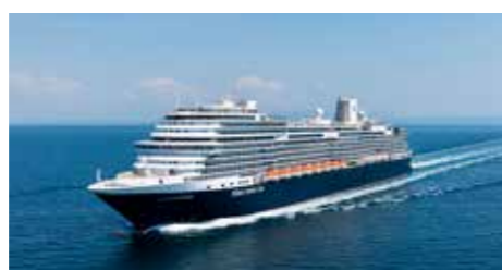
M/s NIEUW STATENDAM en quelques chiffres

Nbre de passagers : 2 668 Membres d'équipage : 1 025 Mise en service : 2021 Longueur : 300 m