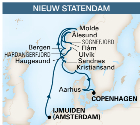
De Ijmuiden (Amsterdam) à Copenhague 12 jours / 11 nuits