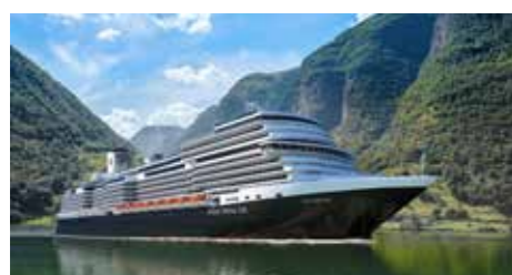
M/s ROTTERDAM en quelques chiffres

Nbre de passagers : 2 668 Membres d'équipage : 1 025 Mise en service : 2021 Longueur : 300 m