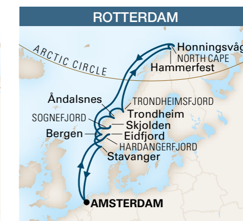
De / A Amsterdam 15 jours / 14 nuits