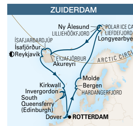
De / A Rotterdam 22 jours / 21 nuits