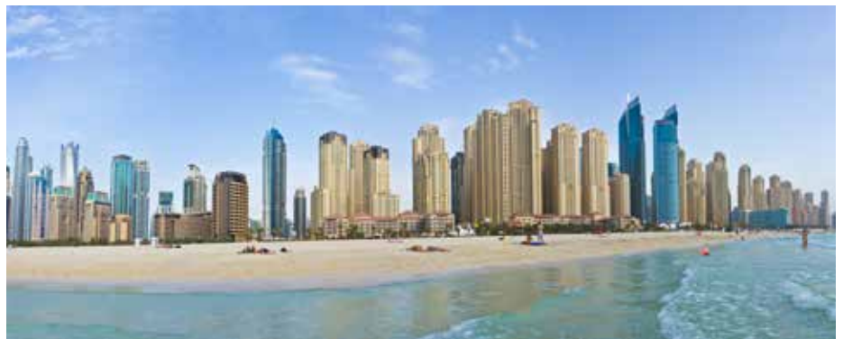
Dubai, Émirats Arabes Unis