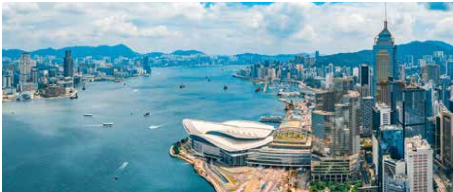
Hong Kong, Chine