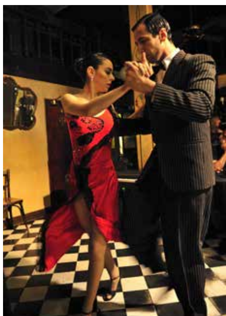
Buenos Aires, Argentine