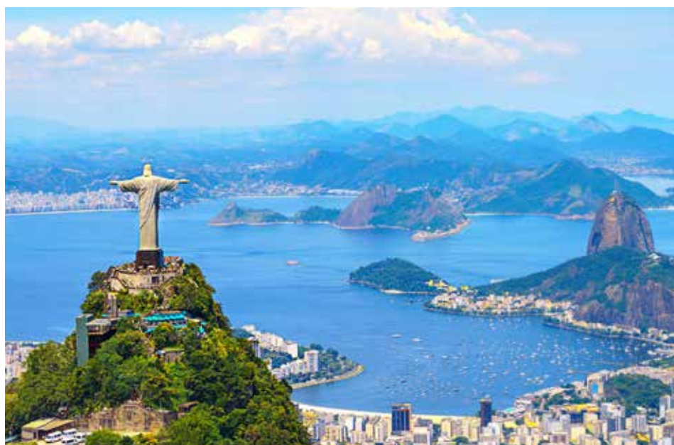
Rio de Janeiro, Brésil