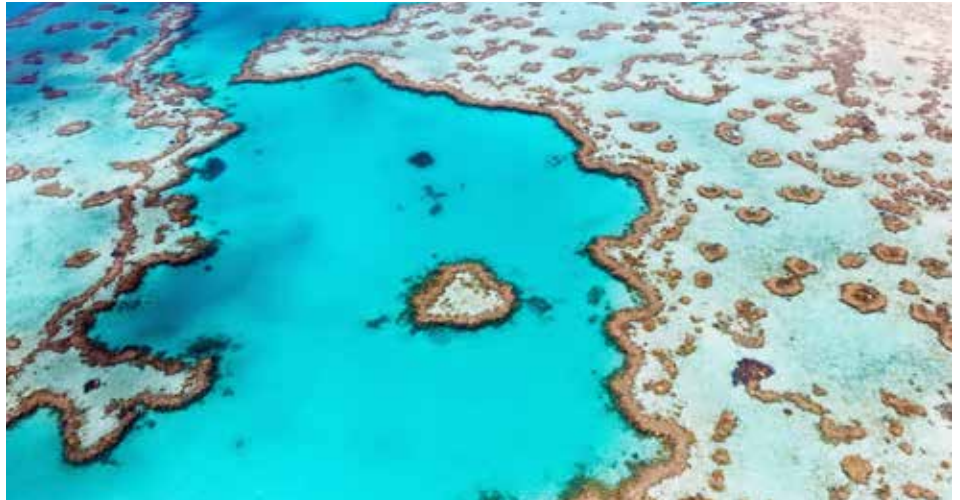
Grande Barrière de Coraills