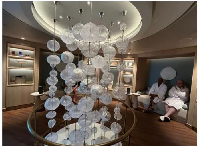
Que serait un navire de croisière sans un spa ?