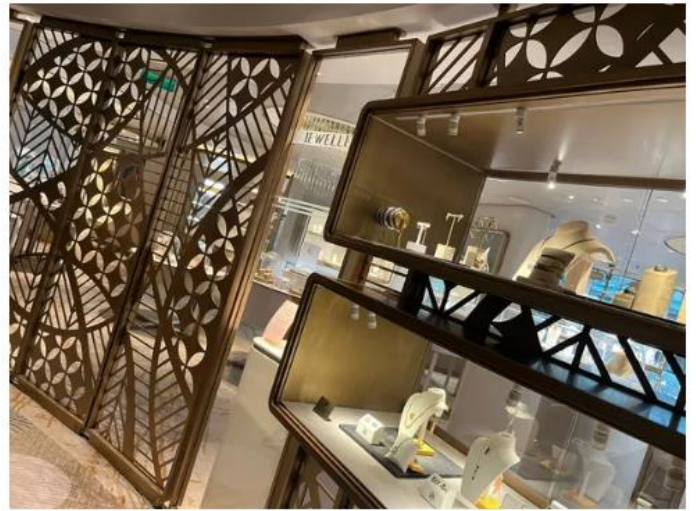
On ne compte plus les boutiques grillagées au style Art déco à l'intérieur du navire.