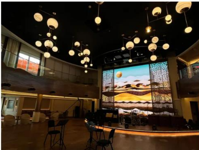
La "Queens room", le cœur du navire avec sa fresque animée qui change de couleurs au fil de la journée, et son lustre rappelant des planètes.

C'est le dernier bébé de la Cunard Line. Et on parle d'un gros bébé de 322 mètres de long, pouvant transporter 3.000 passagers. Le paquebot Queen Anne, la petite sœur du Queen Mary 2, a fait une escale inaugurale à Cherbourg, lundi 14 octobre. Nous sommes montés à bord pour vous faire visiter ce géant des mers de style Art déco.