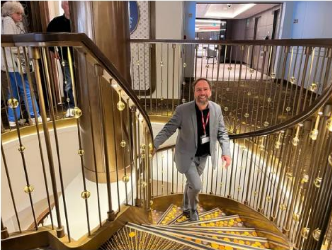
L'architecte français Thomas Kohimüller a participé, avec deux autres cabinets londoniens, à l'aménagement de l'intérieur du paquebot.