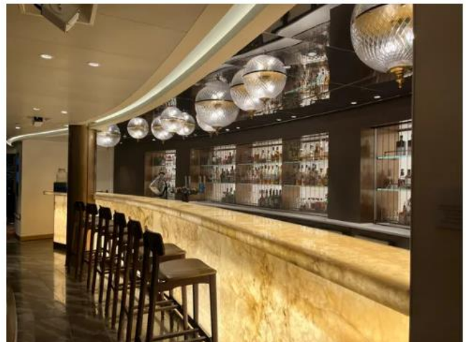
Le comptoir effet marbre du bar de la "Queens room".