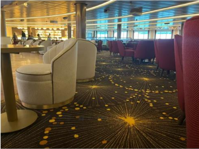
Le spectacle se déroule aussi sous les pieds des passagers.