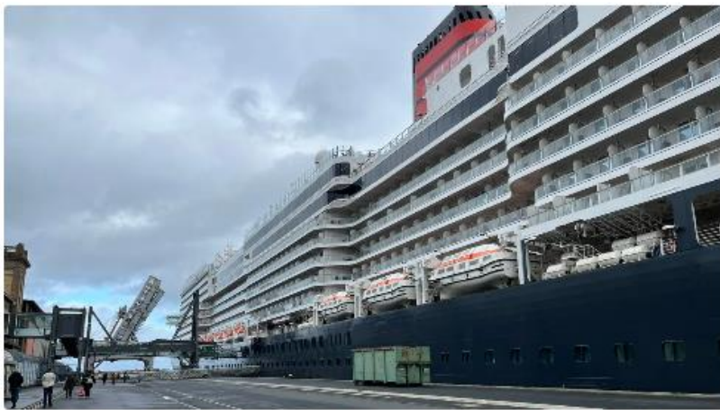
Le Queen Anne, dernier-né de la Cunard Line, lors d'une escale inaugurale à Cherbourg, le 14 octobre 2024.

C'est le dernier bébé de la Cunard Line. Et on parle d'un gros bébé de 322 mètres de long, pouvant transporter 3.000 passagers. Le paquebot Queen Anne, la petite sœur du Queen Mary 2, a fait une escale inaugurale à Cherbourg, lundi 14 octobre. Nous sommes montés à bord pour vous faire visiter ce géant des mers de style Art déco.