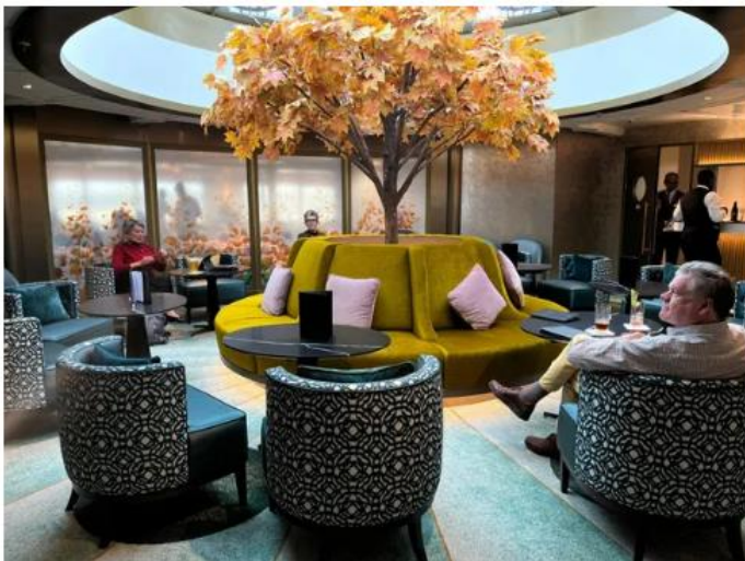
Les croisiéristes rencontrés à bord sont majoritairement britanniques.